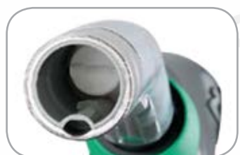
Каплеуловитель для пистолета дизельного топлива