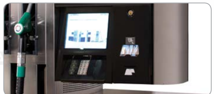
Модули оплаты (CRIND)