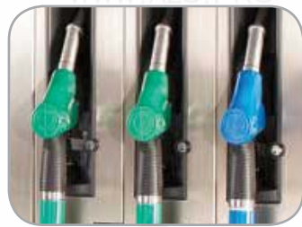
Замки на пистолеты