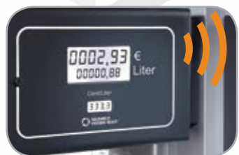
Извещатель сорта топлива