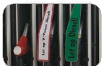
Уведомляющая крышка пистолета дизельного топлива