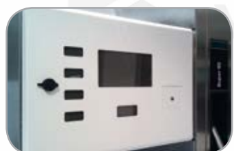
Индикация цены за каждый сорт топлива