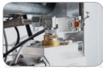
Сигнализация открытия дверец