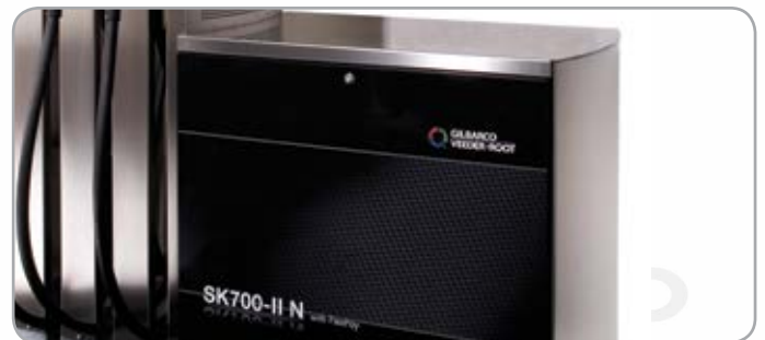
Панели из нержавеющей стали